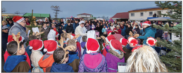
Die "Walschbergknirpse" von der Kindertagesstätte Walschleben rufen den Schnee...