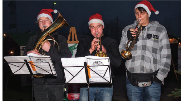
"Doomsday" aus Gebesee spielen Weihnachtslieder auf der Außenbühne