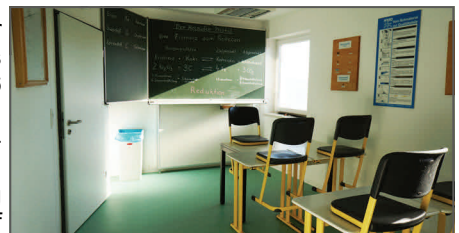
Oben: Metall-Klasse. Unten: BVJ-Klasse

Die kleinen Klassenräume sind so gestaltet, das ein angenehmes Lernklima für die bis zu höchstens vier Schüler pro Klasse entste-