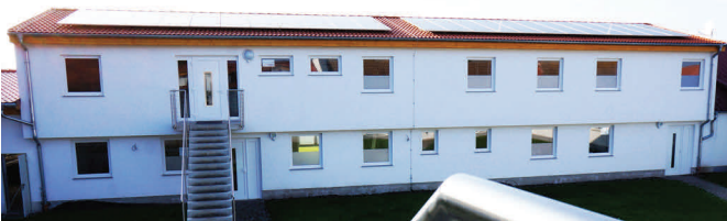
Oben: BBS-Gebäude im 1. OG. Unten: Grundriss