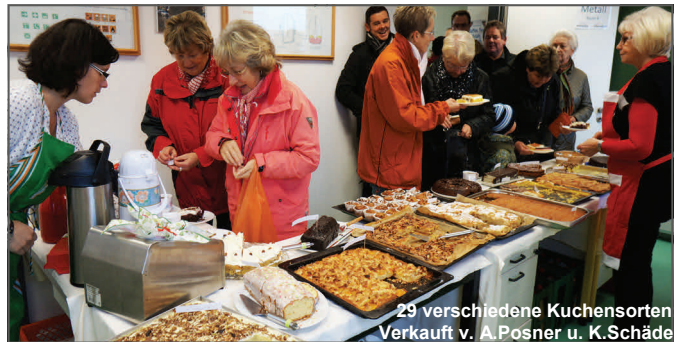
29 verschiedene Kuchensorten Verkauft v. A. Posner u. K. Schäde

arbeitern gebackenen Kuchens und der Werkstattprodukte, die die Auszubildenden und Berufsvorbereitungsjahrschüler unter Anleitung der Ausbilder gebaut haben, geht an „Little Smile“ in Sri Lanka.