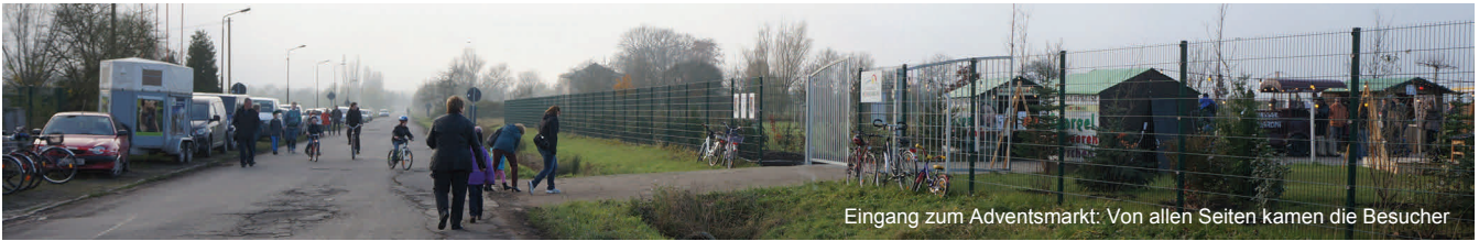
Eingang zum Adventsmarkt: Von allen Seiten kamen die Besucher